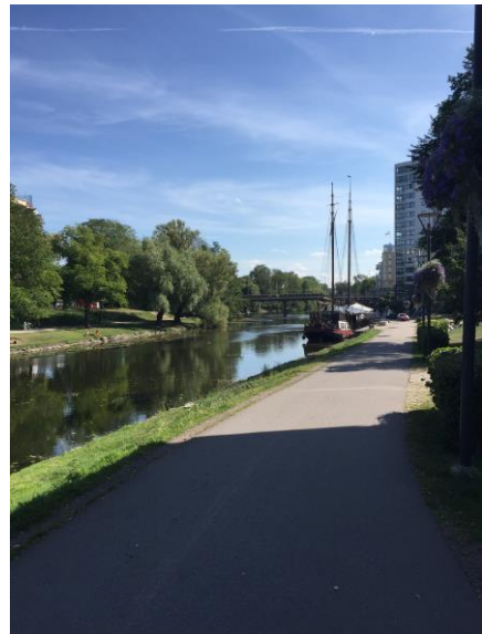
2 Kanal in Linköping