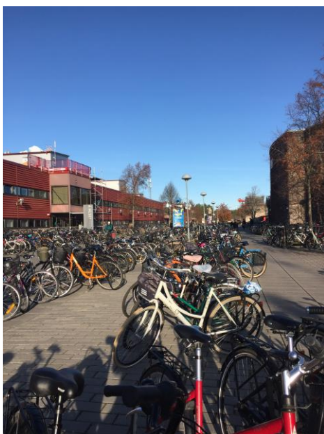
3 Linköping University