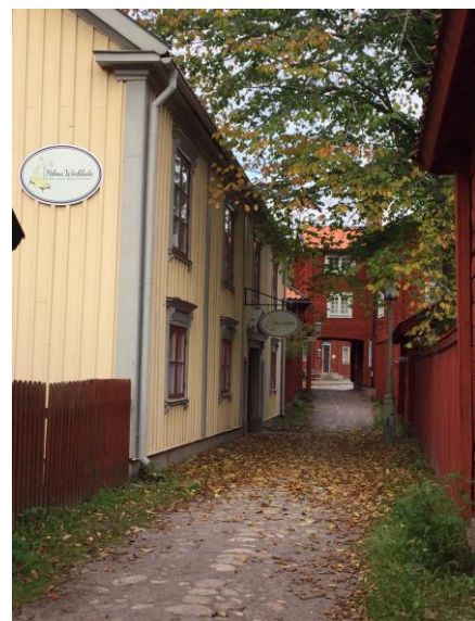
4 Gamla Linköping