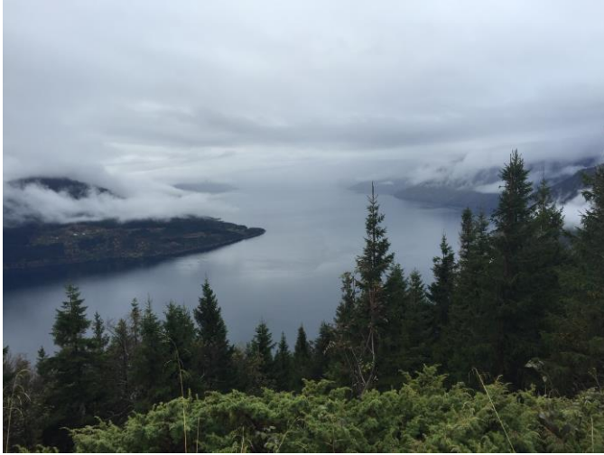
5 Fjord in Norwegen