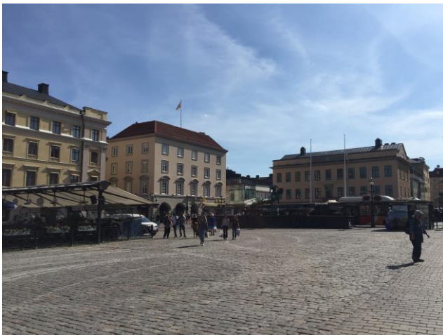
1 Linköping Innenstadt