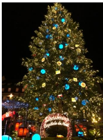
Place Kléber (Dez)