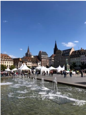
Place Kléber (Sept)