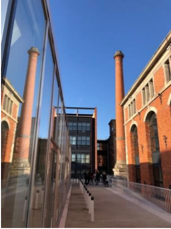
EM Business School (Dez)