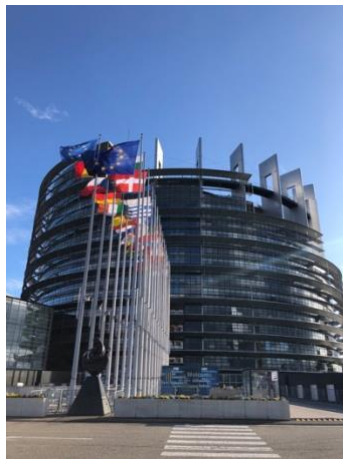
Parlement Européen (Nov)