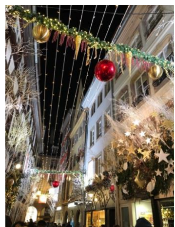
Le Carré d'Or (Dez)