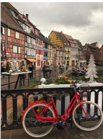
Petite Venise de Colmar (Dez)