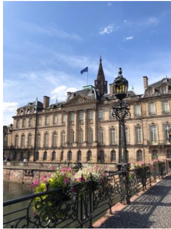
Palais Rohan (Sept)