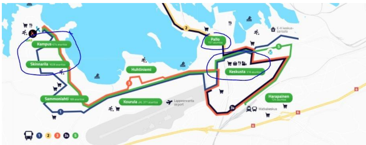
Abbildung 2: LOAS Wohnungskomplexe