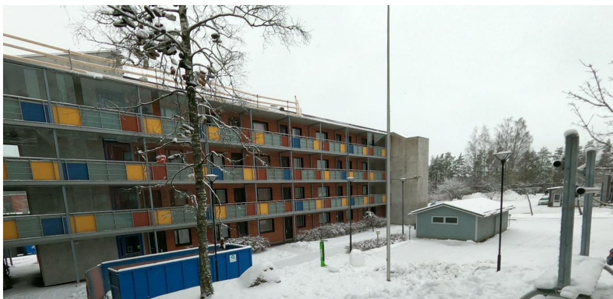
Abbildung 1: Karankokatu 4