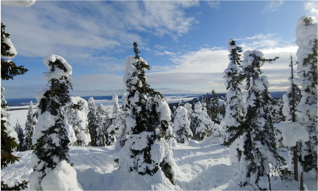
Abbildung 4: Koli Nationalpark