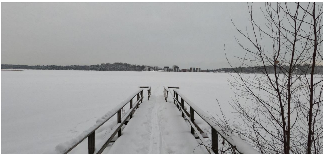
Abbildung 3: Saimaa